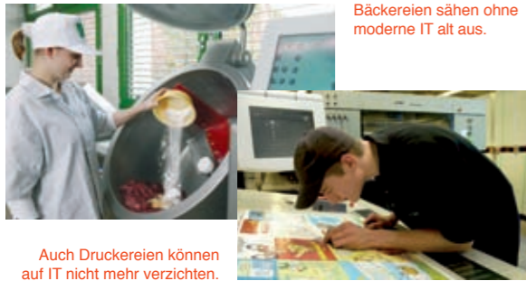
Bäckereien sähen ohne moderne IT alt aus.