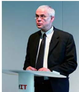
Standortvorteil IT-Kompetenz: Vladimir Spidla zur Auftaktveranstaltung der Initiative IT-Fitness

„Informationstechnologie ist heute ein wichtiges Instrument für gesellschaftliche Integration“, sagte EU-Beschäftigungskommissar Vladimir Spidla zum offiziellen Auftakt der deutschen Initiative am 27. März 2007 in Berlin. „Sie eröffnet unterschiedlichsten Bevölkerungsgruppen die Möglichkeit, qualifizierten Tätigkeiten nachzugehen. Davon werden Wirtschaft und Gesellschaft in Deutschland profitieren.“